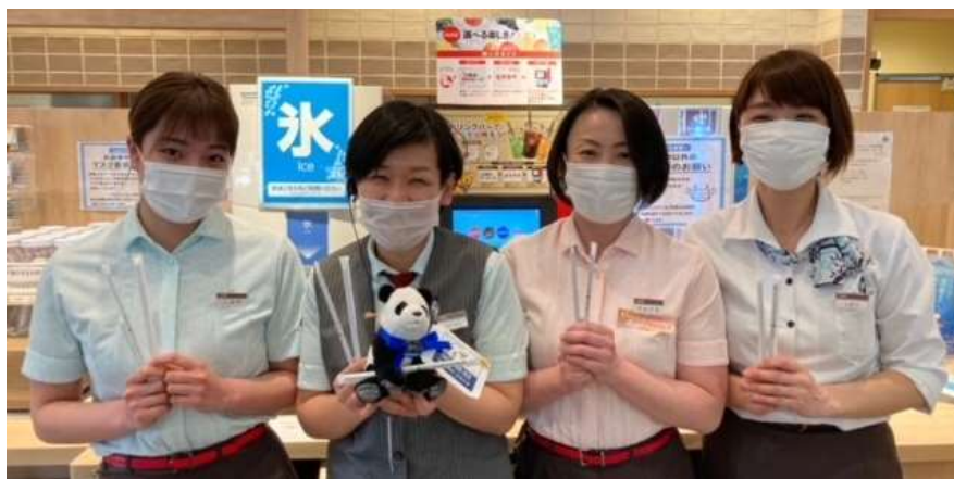
EARTH HOURの親善大使「#旅する60パンダ」が山梨県のデニーズを訪問しています