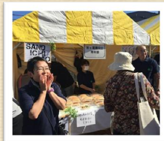
昨年の活動の様子

SUSTAINABLE DEVELOPMENT GOALS 世界を変えるための 17 の目標