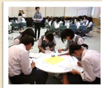
講演の後のグループディスカッション