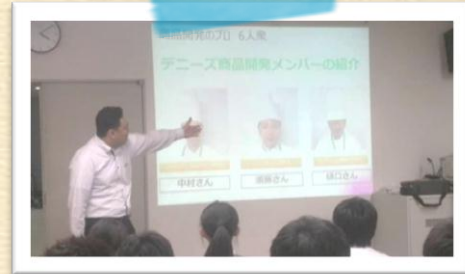
7月13日 ワークショップにて講演（青葉区役所）