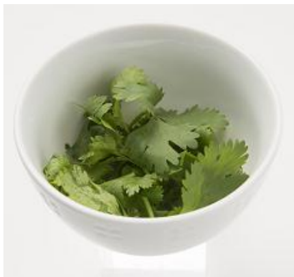
追いパク 99円 (税込 106円)

【パクチー大好き “パクチスト” 集まれ！ オリジナルアレンジで美味しさ無限大！】