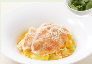
サラダにパクチーの清涼感をプラス！