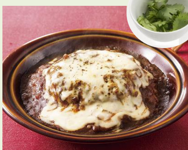
ハンバーグカレードリアにも相性抜群！