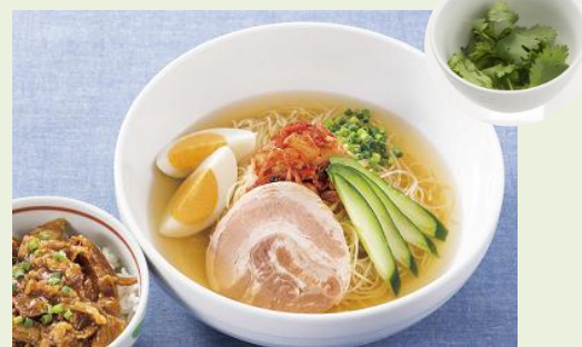
さっぱり冷麺風カペリーニにパクチーの香りをオン！