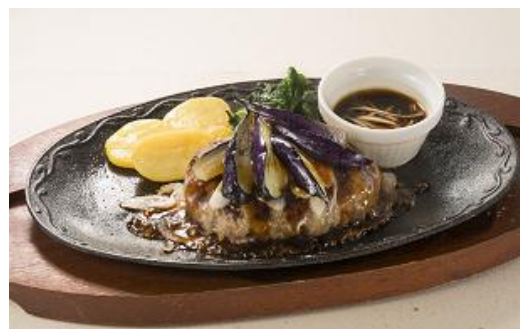
ビーフハンバーグ～生姜醤油ソース

食欲をそそる花山椒の香りや、担々ソースのコクと辛みがクセになるスパイシーなハンバーグです。