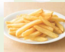
サイドメニューや、ビールやサワーなどのアルコールもアレンジ！