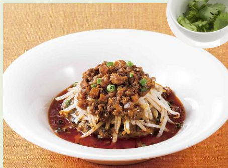
ピリ辛ハンバーグのアクセントに！