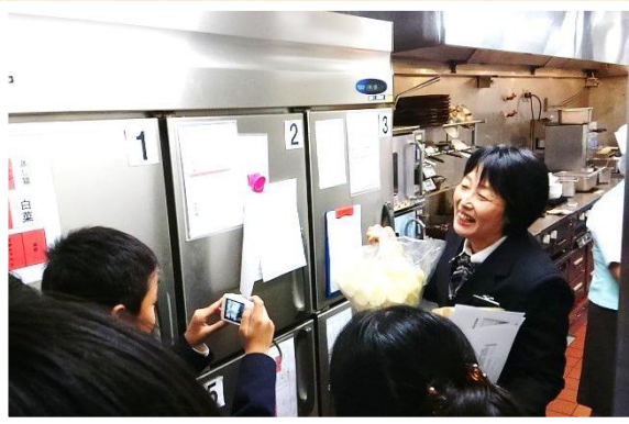
写真を撮りながら熱心に説明を聞いていました