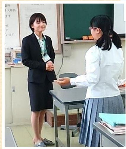
高等学校では近隣の店長や従業員が学校へ出張して「接客研修」を行いました