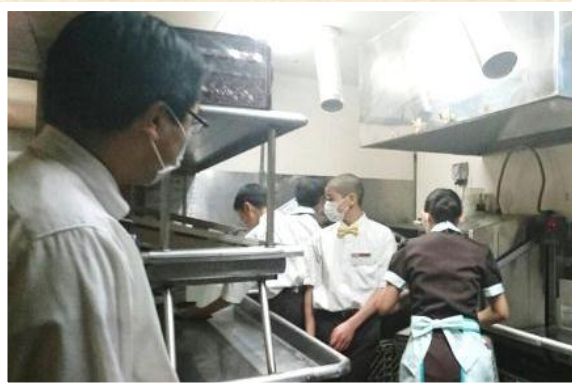
怪我などがないように、店長が見守りながら実習を行います