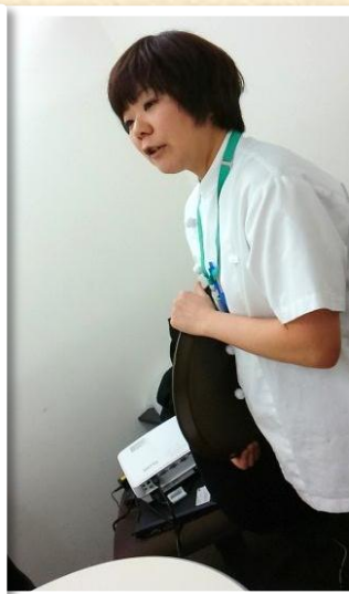
企業見学ではメニュー開発の仕事を説明し、デザートを試食していただきました