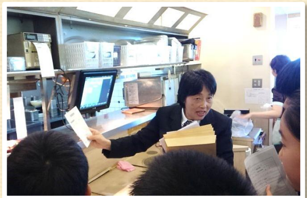
液晶パネルで注文を管理する仕組みに興味深々！