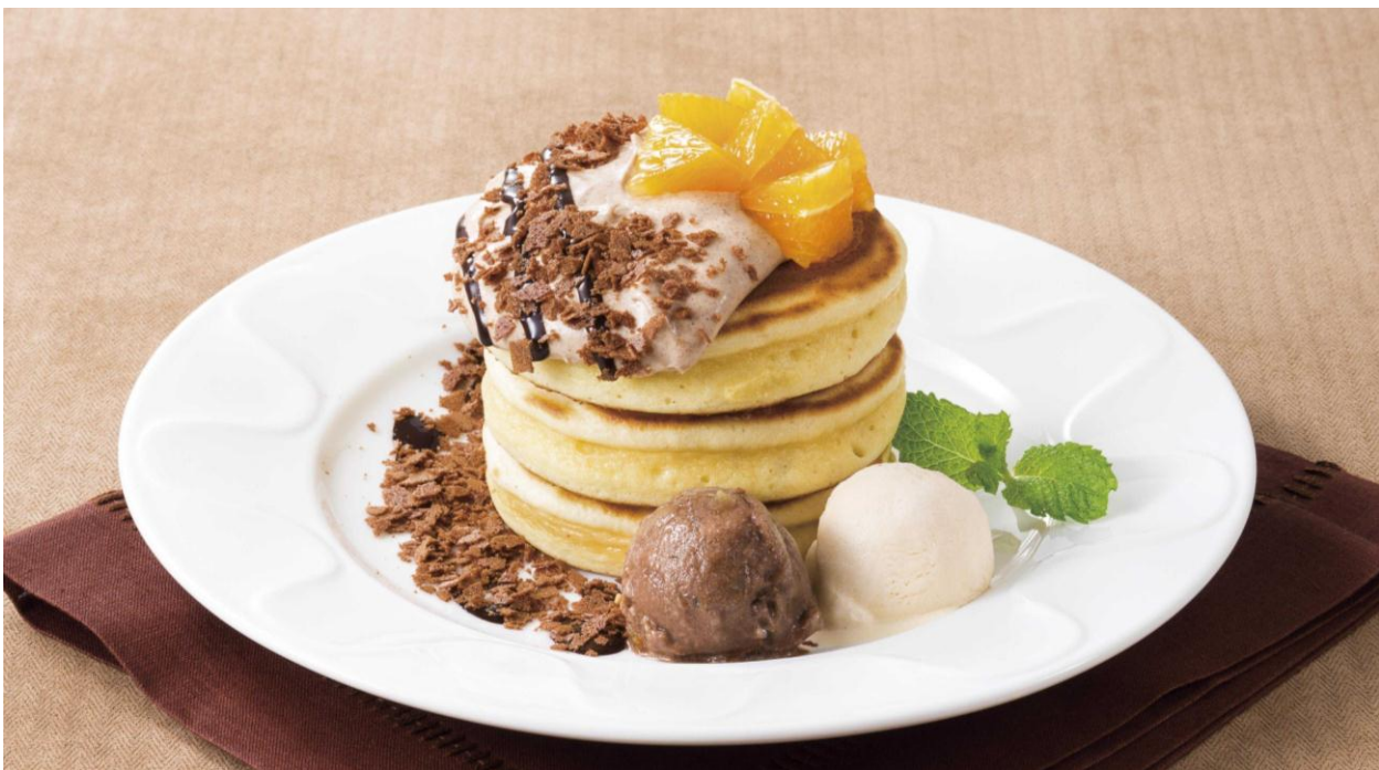
ショコラナッツパンケーキ

美味しさだけでなく、軽やかさと華やかさも追求した今回のチョコレートデザートは、ティータイムにはもちろん、食事の後や、おこさまとのシェアなど、幅広いシーンでお楽しみいただけます。