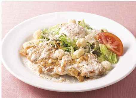
チキンシーザーサラダ (パン・ドリンクつき) 980円

サクッと揚げた大粒の牡蠣フライは、牡蠣の旨みと甘み、香りが口いっぱいに広がります。今回より、広島県産牡蠣を使用致します。