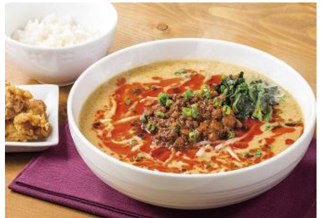
担々麺セット ~鶏の唐揚げ・ミニごはんつき 1,132円

口に入れた瞬間に感じる旨みと深いコクにこだわり、新たに登場した「新・デミグラスソース」をベースにし、マッシュルームとオニオンソテー、クリームを加えたまろやかなストロガノフ風ソースで味わう秋色ハンバーグ。さらにフレッシュのトマトを合わせ、すっきりとした印象のソースに仕立てました。ふっくらジューシーな合挽きハンバーグにたっぷりソースを絡めてお召し上がりください。