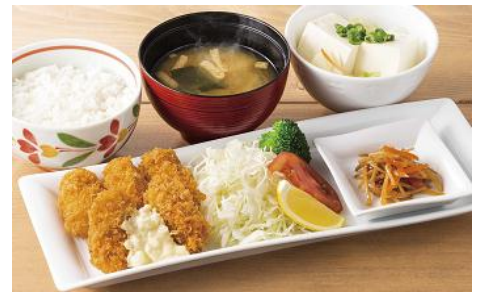
牡蠣フライ膳 ～広島県産牡蠣使用 1,186円

甜麺醤や豆板醤、XO醤など複数の醤(ジャン)を使用し、山椒の風味をアクセントにした複雑で深いコクのある本格麻婆ソースをたっぷりハンバーグにかけました。ごはんにもぴったりの仕立てです。