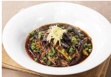
麻婆茄子ハンバーグ 970円

ポルチーニの芳醇な香りを楽しむソースに、素揚げにした新潟県産舞茸や、さつまいも、なすをトッピングした秋の新作パスタです。