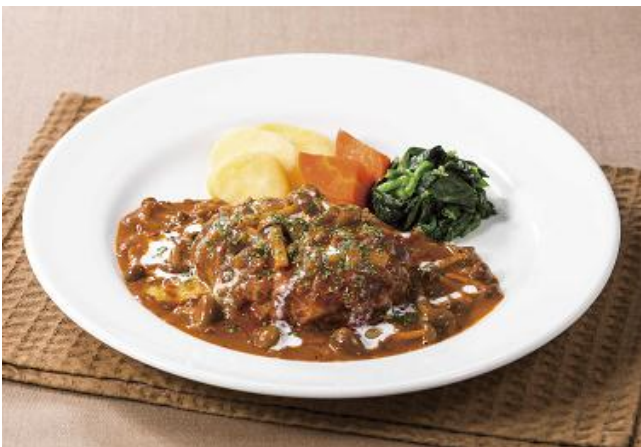
きのこデミクリームハンバーグ ~ストロガノフ風 1,078円

口に入れた瞬間に感じる旨みと深いコクにこだわり、新たに登場した「新・デミグラスソース」をベースにし、マッシュルームとオニオンソテー、クリームを加えたまろやかなストロガノフ風ソースで味わう秋色ハンバーグ。さらにフレッシュのトマトを合わせ、すっきりとした印象のソースに仕立てました。ふっくらジューシーな合挽きハンバーグにたっぷりソースを絡めてお召し上がりください。