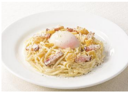
栗のカルボナーラ ～濃厚パルミジャーノ仕立て 970円

デニーズで人気のカルボナーラに季節の栗を合わせました。栗の優しい甘み、ベーコンの塩味、濃厚でクリーミーなソース、パルミジャーノの芳醇な香りすべてが一体となった一皿です。