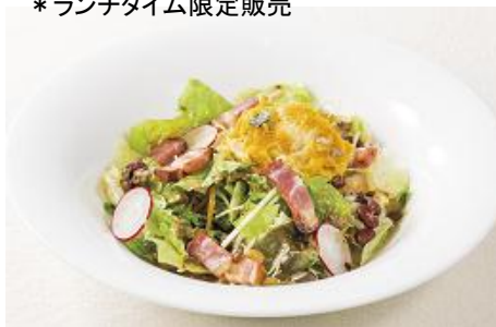
かぼちゃとベーコンのサラダ ～ハニーマスタード 430円

キドニービーンズや生ソーセージなど存在感のある具材がたっぷりのミートソースに、フレッシュのトマトやアボカドを合わせ、オーブンで焼き上げました。ピリッとスパイシーな中南米風のドリアです。