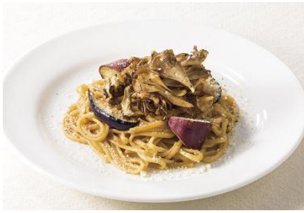
舞茸のポルチーニソース ～新潟県産舞茸使用 970円

ポルチーニの芳醇な香りを楽しむソースに、素揚げにした新潟県産舞茸や、さつまいも、なすをトッピングした秋の新作パスタです。