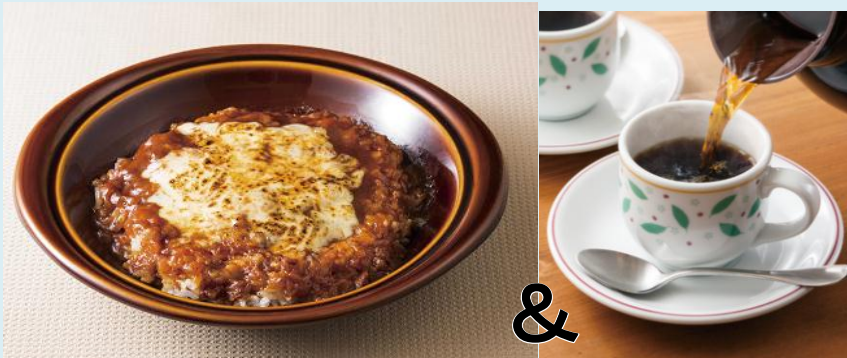
ミートドリア(ドリンクつき) 399円

濃厚なデミグラスソースとミートソースに、チーズがとろけるあつあつドリア。小腹がすいたときにぴったりの軽食メニューです。