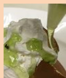
お好きな ソースを かけて