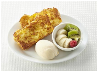
1皿目にはフルーツ&アイスをプレゼント

自由にトッピングできる、クリーム・チョコソース・キャラメルソースやカスタードソースなど10種類以上をご用意。今回から、お好みで追加注文できるお食事系のトッピングメニューや季節のフルーツもご用意しております。 (トッピングの内容は店舗によって変わる場合がございます)