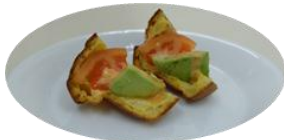
アボカドとトマト