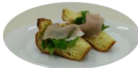
生ハムとルッコラ