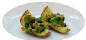
五種豆と五穀とルッコラ

外はサクサク、中はしっとり食感のポップオーバーに、モッツアレラチーズ・トマト・バジル・オリーブオイルをあわせた「カプレーゼ」や、人気の定番アボカドにトマト、コブサラダドレッシングをあわせた「アボカドとトマト」など計4品。