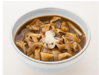
ひもかわうどん カレー南蛮 602円(税込650円)

しっとりとした弾力のある鶏もも肉、しいたけ、人参、小松菜などを盛り込み、具だくさんに仕上げました。ひもかわうどんのもちもちとした食感と、具材の多彩な食感で最後まで飽きさせない一品です。