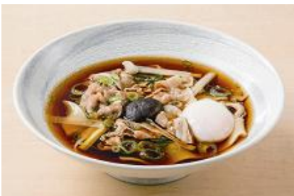
ひもかわうどん 肉すき 778円(税込840円)

豚肉、しいたけ、長ネギを、鯉節とあご(飛魚)でとった出汁を加えたつゆで煮込みました。豚肉の脂から溢れるやさしい甘みが繊細なつゆに溶け込みます。半熟たまごを割り溶かしながら、まるやかな味の変化をお楽しみください。