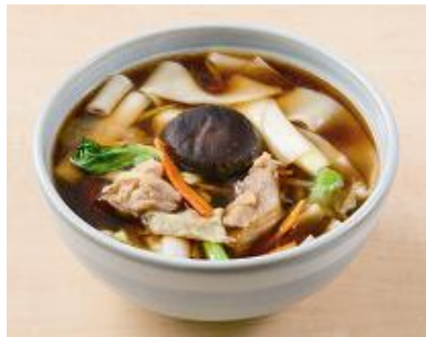
ひもかわうどん かしわ南蛮 676円(税込730円)

豚肉、しいたけ、長ネギを、鯉節とあご(飛魚)でとった出汁を加えたつゆで煮込みました。豚肉の脂から溢れるやさしい甘みが繊細なつゆに溶け込みます。半熟たまごを割り溶かしながら、まるやかな味の変化をお楽しみください。