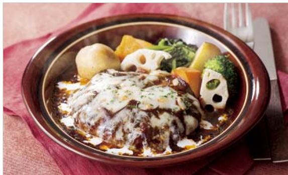
ごろごろ野菜のデミ煮込みハンバーグ 890円

アンデスポテト、れんこん、かぼちゃ、ほうれん草、ブロッコリーなど8種の素材とジューシーなハンバーグをデミグラスベースのソースで煮込み風に仕立てた一皿。炒めた野菜、フンドボーにワインを加えたデミグラスソースは旨味たっぷりで、ハンバーグの肉汁、とろけるチーズと合わさると、奥深くコクのある味わいがお楽しみ頂けます。