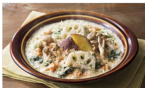
サーモンとほうれん草の五穀ドリア ～五豆入り 840円

甘口のもろみ味噌「金山寺味噌」に漬け込み焼き上げた「ぶり」のご膳が登場。ぶりは尾鷲湾で育った三重県産を使用しています。船上で活々、血抜きをしっかり行った臭みのない切身を金山寺味噌に漬け、2日間じっくり低温熟成させました。脂がのったぶりと香ばしい味噌はご飯に合い、口へ運ぶとほのかに甘みが広がります。小鉢は3種類よりお選び頂けます。