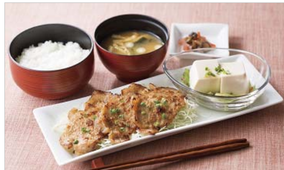
オーリービーポークのごま味噌焼き膳 1,090円

アンデスポテト、れんこん、かぼちゃ、ほうれん草、ブロッコリーなど8種の素材とジューシーなハンバーグをデミグラスベースのソースで煮込み風に仕立てた一皿。炒めた野菜、フンドボーにワインを加えたデミグラスソースは旨味たっぷりで、ハンバーグの肉汁、とろけるチーズと合わさると、奥深くコクのある味わいがお楽しみ頂けます。