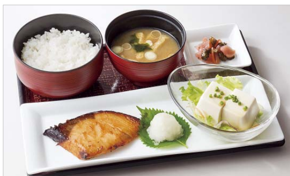
ぶりの金山寺味噌焼き膳 990円

デニーズが開発した、オレイン酸を豊富に含む「オーリービーポーク」のロース肉を麴と胡麻を混ぜ込んだ味噌に漬け込み、香ばしく焼き上げました。麴の働きで旨みが増し、味噌の甘みと胡麻の風味が加わったオーリービーポークは、後を引く味わいです。小鉢は、「豆腐サラダ」「なすのみぞれ和え」「きんぴらごぼう」の3種類からお選びください。