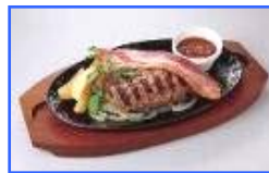
←厚切りベーコン&ビーフ100%ハンバーグ

今回のハンバーグフェアは、ご紹介の新メニューの他、野菜も摂れる人気の「アボカドハンバーグ(790円)」、まろやかな酸味の黒酢と生姜が効いたソースで味わう「季節野菜のさっぱり四元豚ハンバーグ(890円)」、肉と相性抜群のマスタードソースを添えた「厚切りベーコン&ビーフ100%ハンバーグ(1,090円)」、肉の旨みを味わえる「プレミアム ビーフ100%ハンバーグ《220g》さっぱりおろしソースor デミグラスソース (980円)」、香ばしく焼き上げたチーズが味の決め手の「焼きチーズハンバーグカレードリア(880円)」の全10品で開催致します。