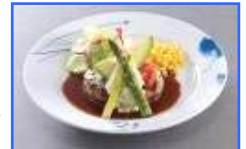
アボカドハンバーグ →