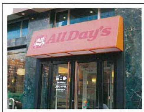
「奥楽多(AllDay's)朝陽長虹橋店 店内」