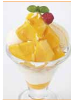
【フレッシュマンゴーのミニパルフェ】 390円