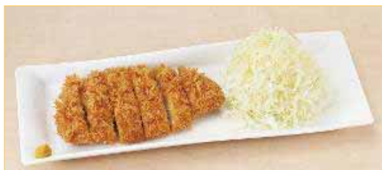
【四元豚のロースとんかつ】760円

この他、生パン粉付けで剣立ちの良いサクサクした食感の衣で包まれた【四元豚のロースとんかつ】760円、鯉だしのタレと卵でとじるかつ丼とうどんの組み合わせ【四元豚のかつ丼うどん】1180円を販売致します。