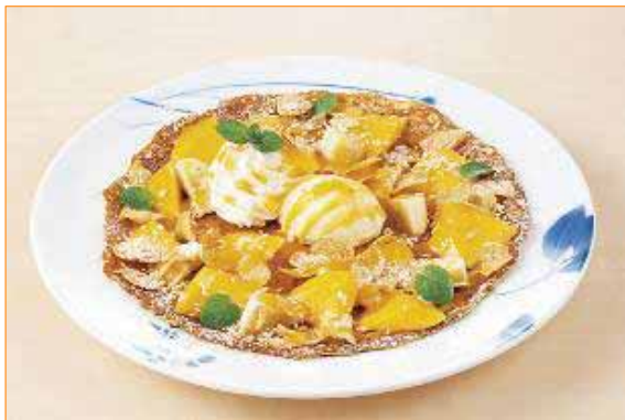
【自家製マンゴーのガレット ~ココナッツ風味~】 580円 程よい甘さと食感が楽しいガレットは、ご注文頂いてからお店でココナッツの入った生地を焼き上げます。フレッシュなマンゴーは、ふんだんに飾りつけられるだけでなく、お店で作るデザートソースにも使っています。食後にシェアしても楽しんで頂けるサイズ、デニーズならではのデザートです。

Thank you mama and my little girl. I love you!