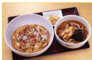
【四元豚のかつ丼うどん】1180円