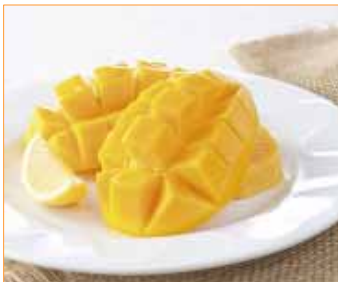
【完熟!フィリピンマンゴー】 450円 空を飛んできたフレッシュな果実をストレートに味わっていただきたい!と思います。口の中ですとろける食感、甘みと酸味の絶妙なコントラスト、美味しさを存分にお楽しみいただける、この季節に最適なフルーツです。お好みで、添えたレモンをちょっと搾ってお召し上がりください。