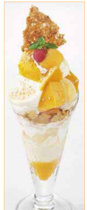
【フレッシュマンゴーのザ・サンデー】 630円

表示価格はすべて税込み価格でございます。 こちらでご紹介するメニューを一部取り扱わない店舗、また、取扱いがない時間がございます。ご了承ください。