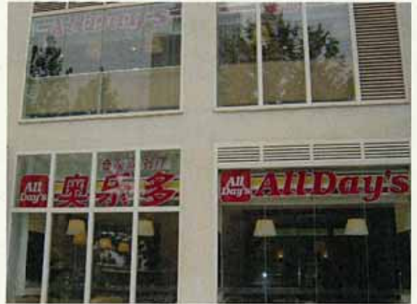
「奥乐多(AllDay's)朝陽建外店 店内」