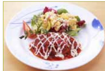
イタリア産トマトとチーズのソースで仕上げたハンバーグ 【近海で獲れたさばの照り煮御膳】 880円

<170gハンバーグ> 【イタリアンハンバーグ-イタリア産トマトのソース使用】 880円