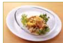
【インカのめざめのポテトサラダ】 290円 【オニオンリング】 290円 ・この他、知床鶏の唐揚げなど多数ご用意しています。