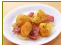
インカのめざめのジャーマンポテト