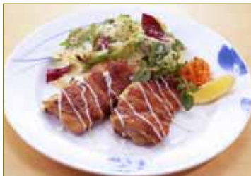
ステーキ並みのボリュームのチキンをサラダ仕立てに ・この他、チキングリル ガーリック醤油風味780円もご用意しています。