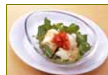
【有機豆腐のポン酢サラダ】150円