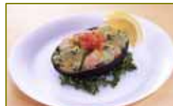
海老アボカドサラダ