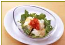
有機豆腐のポン酢サラダ

ザ・ベジタブル! ~春ver.~ 480円 今が旬のインカのめざめ、キャベツ、筍や人参、ブロッコリー、プチトマト、3種の豆と生ベーコンをコンソメで煮込み、ケツツを添えたスープ仕立ての温野菜。