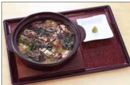
ちょっと小腹がすいた時にぴったりの体にやさしい雑炊。何とエネルギーは約300kcal。