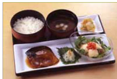
八戸産のさばを丁寧に煮付け、小鉢をつけ御膳仕立てに *一部取り扱いのない店舗がございます。