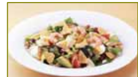
Big Chef's Cobb サラダ