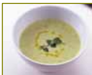
春野菜のグリーンポタージュ