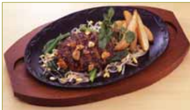
”野菜たっぷり”の仕立てのバリューハンバーグ ・この他 和風ハンバーグ780円, 焼きチーズのデミマ煮込みハンバーグ880円などをご用意しています。

<170gハンバーグ> 【イタリアンハンバーグ-イタリア産トマトのソース使用】 880円