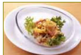
インカのめざめのポテトサラダ