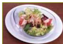
【ミニツナサラダ】 150円