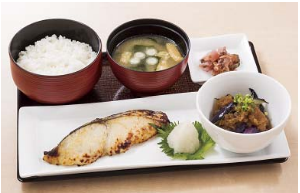
さわらの西京焼き膳 940円

平たい板状のパスタの一種“ラザニア”。その生地にはほうれん草を練り込み、たまねぎ・にんじん・セロリなどの野菜をベースにクリームを加えた「ベジタブルクリームソース」と「ホワイトソース」の2種類のソースを挟みました。チーズをかけ、グリーンアスパラ、トマト、パプリカ、ブロッコリーを彩りよくのせ、オーブンで焼き上げたラザニアは、312kcalとカロリーも控えめです。