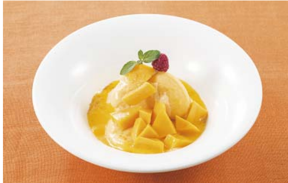
マンゴーパナッシェ 530円

4～5月に旬を迎えるフィリピン産マンゴー。デニーズでは鳥のくちばしに似た形から「ペリカンマンゴー」とも呼ばれている“カラバオ種”を用いたデザートをこの旬の時期に販売致します。タイミングを計って収穫、航空便輸送し、熟度管理した食べ頃のマンゴーを、最も美味しい状態でお客様のテーブルへとお届けします。フレッシュだからこそ味わって頂ける、口の中でとろける食感、甘みと酸味のバランスが絶妙なマンゴーを使った“デニーズならではの”デザートをお楽しみください。