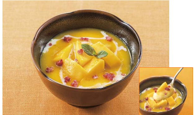
自家製とろ～りマンゴープリン 390円

パナッシェとは、フランス語で「盛り合わせた」を意味する言葉。色々なマンゴーの魅力を一度に楽しめるよう、一皿に盛り込みました。フレッシュのマンゴー、なめらかなマンゴープリン、濃厚な味わいのソルベ、シャリシャリ食感が楽しいウラッシュアイス、自家製ソースに至るまで、まさにマンゴーづくし。それぞれに表情の異なるマンゴーをお召し上がり頂けます。