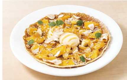
自家製 マンゴーのガレット 580円

甘くてみずみずしい、旬のフィリピンマンゴーをそのままお楽しみ頂ける一皿。口当たりがなめらかで、甘みと酸味のバランスの良さが特徴です。栽培から出荷まで一貫した品質管理を行っていますので、お店で最も美味しい状態を提供致します。