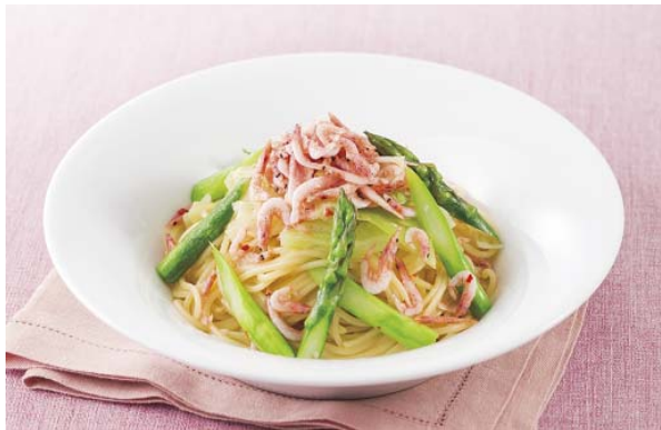
桜海老とアスパラガスのスパゲティ 890円

デニーズで人気の「アボカドハンバーグ」が今春も登場。ハンバーグにアボカド、グリーンアスパラ、トマト、レタスなどのフレッシュ野菜、今年にはさらにブロッコリーやゆで卵を盛り合わせました。大きめにカットしたまろやかなアボカドとハンバーグは相性よく、テリヤキとタルタルのダブルソースを絡めると、肉の旨みがより一層引き立ちます。