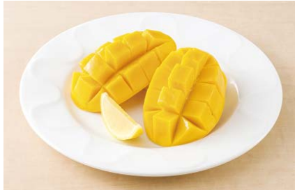
完熟！フィリピンマンゴー 450円

フレッシュマンゴーを使用し、お店で手作りするなめらかな自家製マンゴープリン。プリンの上にマンゴーソースを一面に流し、フレッシュマンゴーをトッピング♪ マンゴーと相性のよいコンデンスミルクをかけ、ラズベリーを散らして、甘酸っぱさをプラスしました。口いっぱい広がるマンゴーの香りと味をお楽しみください。