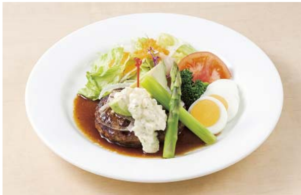
アボカドハンバーグ 890円

デニーズで人気の「アボカドハンバーグ」が今春も登場。ハンバーグにアボカド、グリーンアスパラ、トマト、レタスなどのフレッシュ野菜、今年にはさらにブロッコリーやゆで卵を盛り合わせました。大きめにカットしたまろやかなアボカドとハンバーグは相性よく、テリヤキとタルタルのダブルソースを絡めると、肉の旨みがより一層引き立ちます。